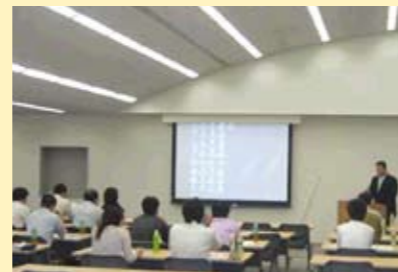
技術研修（テクノセンターにて）

2006年9月11日、当社、環境事業部のお客様である、京都大学工学部技術系技官23名を対象に、技術研修を実施しました。 当社が昨年発行した「環境報告書」をテキストにして、事業概要、環境保護への当社の取り組みを紹介しました。 その後当社の研究施設であるテクノセンターへ案内し、技術開発拠点の見学を通じて貴金属リサイクル事業の意義をご理解いただきました。